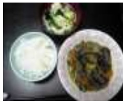
牛丼のトマトのせと吸い物 野菜炒めと味噌汁 なすの味噌炒めと吸い物