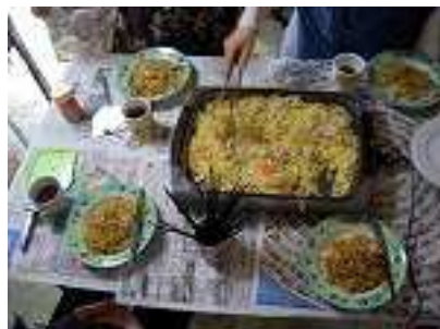
みんなで作った焼きそばです。!