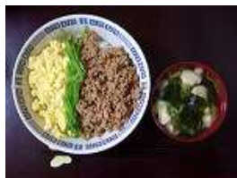
豚テキとマカロニサラダ 三色丼と吸い物